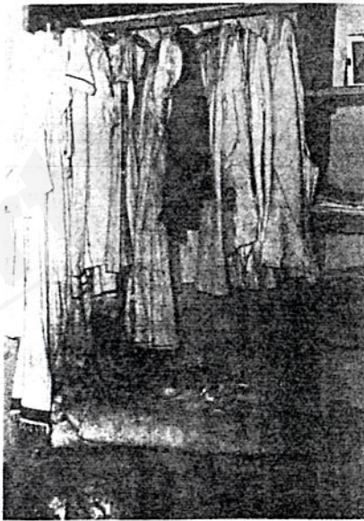
የገነተ ጽጌ ት ጊዮርጊስ የሴቶች በጎ አድራጎት ድርጅት ከሚሠራቸው ዕቃዎች በኩል =

ዚህም አልፎ ሴቶች ቤተ ክርስቲያ ን የምትሻሻልበትንና ቤተ ክርስቲያን የገ ናቸው። እንደሚታዩት ወይንም በፊት ምን ም እንደሆነ በቤተ ክርስቲያን ውስጥ ገብተ